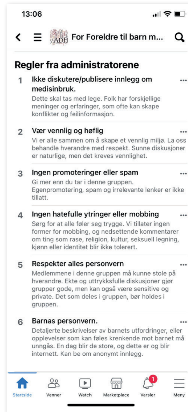
Skjermdump fra en foreldregruppe for barn med en konkret diagnose, som viser at barns personvern kommer lengst ned på listen over regler administratorene mener bør følges.